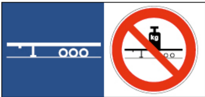
Рис. 6.14. Пример знака безопасности, запрещающего расцепление автомобиля и груженого полуприцепа

Прицепы, не оснащенные тормозной системой, должны удерживаться в неподвижном состоянии посредством использования, по меньшей мере, одного противооткатного упора.