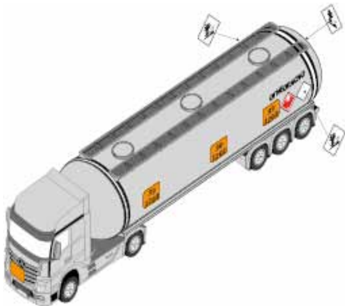
Рис. 5.9. Места крепления на автоцистерне маркировочных знаков для веществ, опасных для окружающей среды

Знак вещества, опасного для окружающей среды, не требуется крепить к автоцистернам с битумом (№ ООН 3257), кроме случаев, когда грузоотправитель сделал в транспортном документе запись «Опасное для окружающей среды».