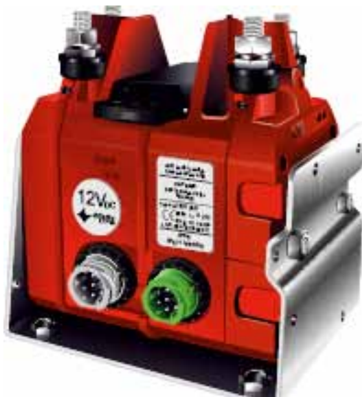
Рис. 3.7. Главный выключатель аккумуляторной батареи для транспортного средства FL

от случайного воздействия и иметь четкую маркировку (рис. 3.8). Защита устройств от случайного воздействия может обеспечиваться при помощи защитного кожуха, двойного выключателя или другим надежным способом.