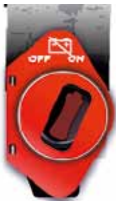
Рис. 3.8. Пример защиты и маркировки устройства, управляющего главным выключателем аккумуляторной батареи

от случайного воздействия и иметь четкую маркировку (рис. 3.8). Защита устройств от случайного воздействия может обеспечиваться при помощи защитного кожуха, двойного выключателя или другим надежным способом.