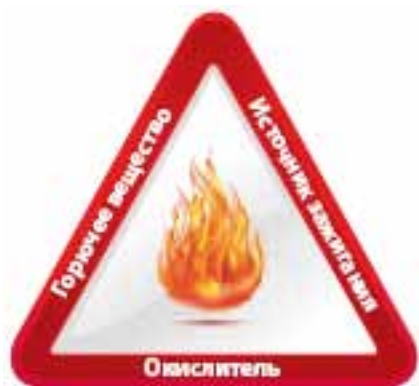
Рис. 2.2. Пожарный треугольник