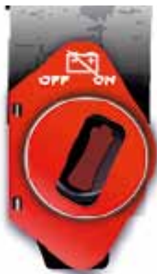
Рис. 3.8. Пример защиты и маркировки устройства, управляющего главным выключателем аккумуляторной батареи

от случайного воздействия и иметь четкую маркировку (рис. 3.8). Защита устройств от случайного воздействия может обеспечиваться при помощи защитного кожуха, двойного выключателя или другим надежным способом.